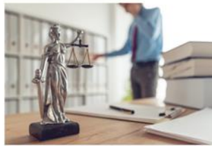
Rechts- und Steuerberatung