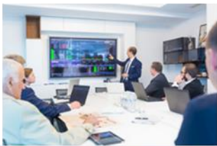
Management- und IT Consulting