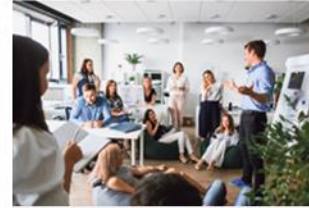
Marketing und Internet Services