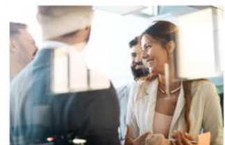
Finanz-DL / Banken / Versicherungen