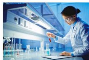
Chemie-, Pharma-, Medizin-Technik