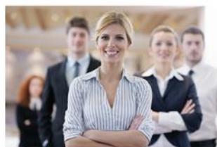
Industrie / prod. Gewerbe / DL